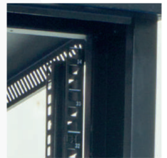
▶ Soportes de fijación verticales con identificación de unidades de Rack.