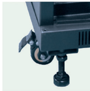
▶ Ruedas con freno y niveladores.